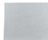
Brusný papír 3M