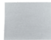
Brusný papír 3M